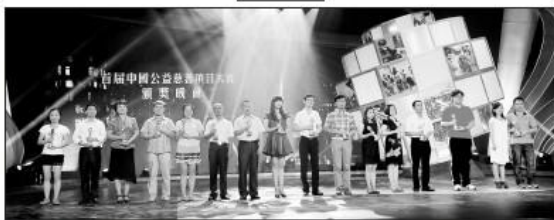
图为去年首届中国公益慈善项目大赛颁奖典礼现场。

在决赛阶段，项目团队将有机会向评委展示项目的实际成果和社会影响力。此外，大赛还设立了“公益之星”等奖项，以表彰在公益领域做出突出贡献的个人和组织。