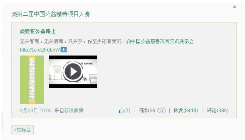
大赛微短片微博投放